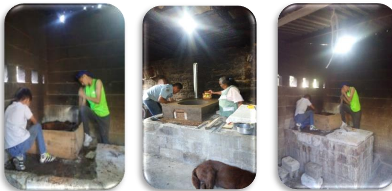
Fig. 14, 15 y 16. Revisión y orientación de salida del humo

y la orientación de salida de la chimenea para expulsar el humo contaminante derivado por la combustión y quema de leña (Fig. 14, 15 y 16).