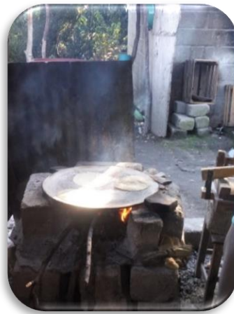
Fig. 11. Tortillas en comal de barro

porque ella las hace en comal de barro y comenta que las personas "Quieren tortilla de ésta, de comal de barro" (Fig. 11).