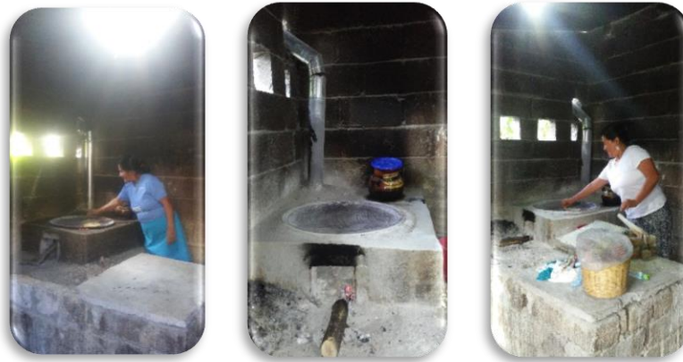
Fig. 17. Tortillas en comal de barro

sigo haciendo tortillas, una tras otra rama seca le pongo, como si fuera horno de pan!”