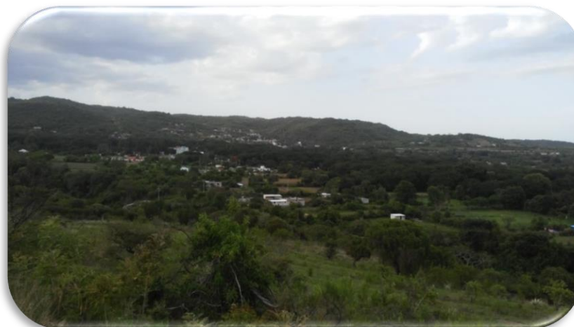
Fig. 2. Vista panorámica de San Francisco Huilango, Tochimilco, Puebla

son de temporal y 429 son de cerril, mientras que 95 hectáreas están en conflicto con el poblado próximo de Tochimizolco (Fig. 2).