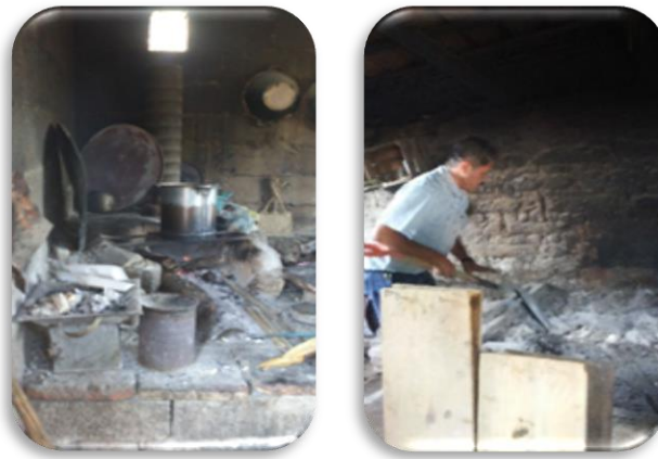
Fig. 12 y 13. Construcción de una EALT en una 'mesita' o 'tlecuil' como base