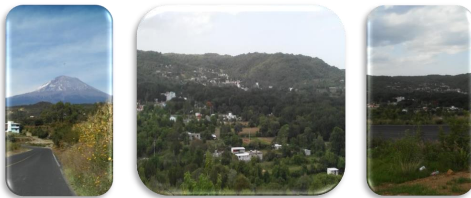
Fig. 3, 4 y 5. San Francisco Huilango, Tochimilco, Puebla

son menores de edad. Hay 205 hogares, de los cuales 78% tiene instalaciones sanitarias, 93% tiene energía eléctrica y 89% tiene agua entubada. Algunos adultos hablan castellano y náhuatl. La actividad principal es la agricultura (INEGI, 2010) y, finalmente, esta localidad presenta un alto grado de marginación (Fig. 3, 4 y 5).