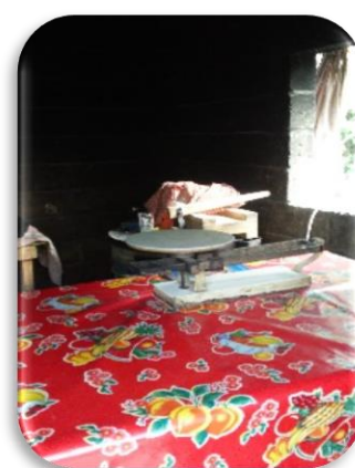
Fig. 8, 9 y 10. Haciendo y vendiendo tortillas por más de 11 horas diarias