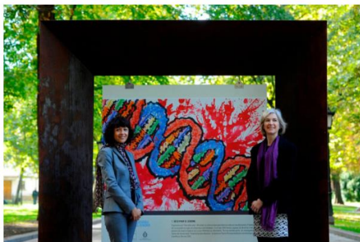
Emmanuelle Charpentier, left, and Jennifer A. Doudna in Oviedo, Spain, in 2015.