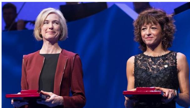
Charpentier y Doudna, al recibir el premio.