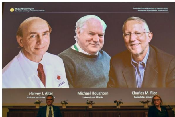
Figura 3. Harvey Alter, Michael Houghton and Charles Rice shared the 2020 Nobel Prize in Physiology or Medicine.

Los Drs. Harvey J. Alter, Michael Houghton y Charles M. Reciben el premio por descubrimiento del virus de la Hepatitis C. El comité del Nobel dijo que los tres científicos "hicieron posibles análisis de sangre y nuevos medicamentos que han salvado millones de vidas".