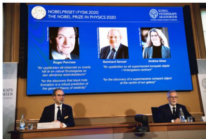
Roger Penrose, Reinhard Genzel and Andrea Ghez are the recipients of the Nobel Prize in Physics for 2020.

Roger Penrose, Reinhard Genzel y Andrea Ghez recibieron el premio el martes por sus descubrimientos que han mejorado la comprensión del universo, incluido el trabajo sobre los agujeros negros.