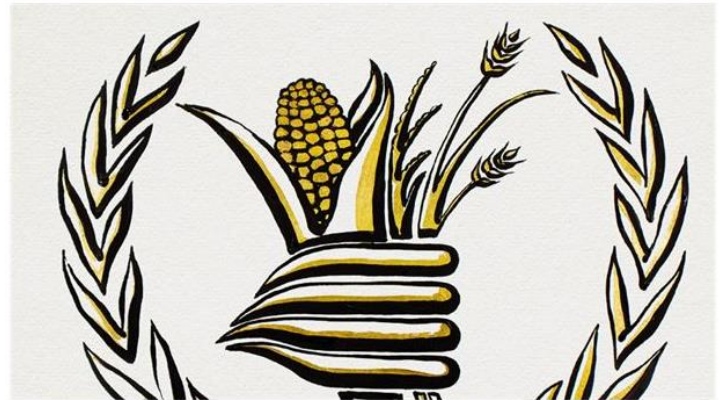
Logo del Programa Mundial de Alimentos, en una ilustración de @nobelprize.