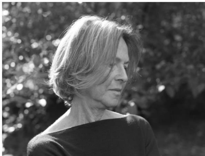
Figura 6. Ganadora del premio de Literatura 2020.

El Premio Nobel de Literatura fue otorgado el jueves a Louise Glück, una de las poetas más célebres de Estados Unidos, "por su inconfundible voz poética que con austera belleza hace universal la existencia individual".