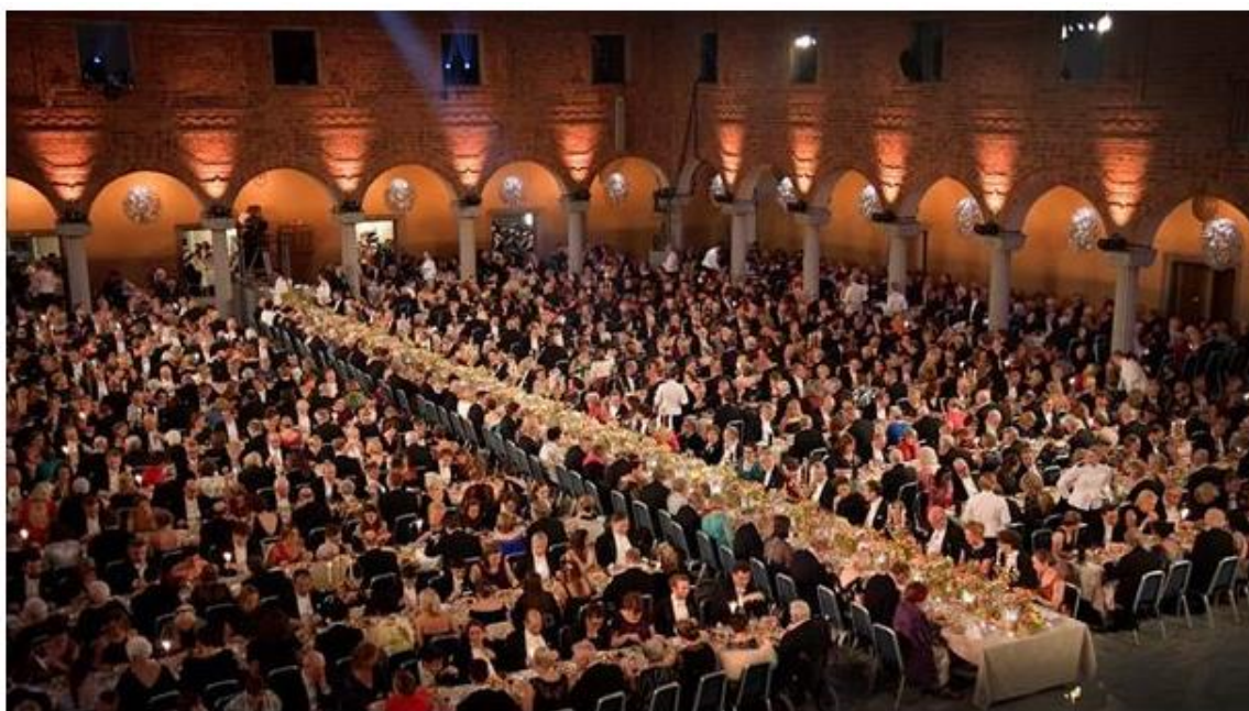
Ceremonia de los Premios Nobel 2019.

Todos los premios llevan incluida una dotación económica, que este año ha aumentado a 10 millones de coronas suecas (956,786 euros), un millón más respecto al año anterior. En los casos con más de un galardonado el dinero se repartirá entre los premiados.