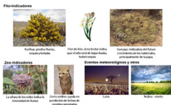
Figura 2. Fito-indicadores, zoo-indicadores, eventos meteorológicos y otros (Mamani & Pimentel, 2019; Claverías, R., 2000).

comportamiento de ocho indicadores naturales (fitoindicadores, zooindicadores, fenómenos meteorológicos y otros), y a partir de ellos planifican y toman decisiones enfocadas en sus cultivo, considerando periodos de siembra (siembra temprana, intermedia o tardía) y lugares de siembra (Mamani & Pimentel, 2019), como se muestra en la Figura 2 donde los productores al observar estos indicadores concluyen que cual es el mejor momento para la siembra.