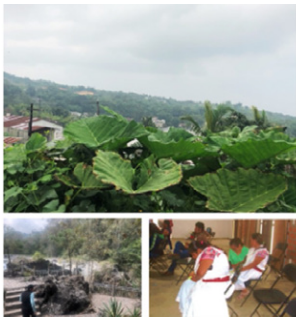
Figura 3. Cooperativa cafetalera en Cuetzalan del Progreso, Puebla.

Los productores de café son ejemplo interesante del ejercicio de percepción de los efectos del clima en las diferentes etapas de la planta, que ha permitido el desarrollo de conocimiento para adaptarse a cambios no solo del ambiente sino sociales y económicos, presentando diferencias entre las comunidades cafetaleras las cuales residen principalmente en la cosmovisión y el manejo tradicional que cada una lleva apoyadas en las tecnologías agrícolas tradicionales (Figura 3); a apreciarse es el caso de los cafetales de la sierra de Zongolica Veracruz, donde se utilizan instrumentos simples y manuales (Martínez, et al., 2019).